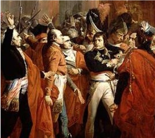
Le général Bonaparte au Conseil des Cinq-Cents, à Saint-Cloud. 10 novembre 1799 (détail) François Bouchot - 1840 (coup d'état du 18 brumaire)

A l'aide des opposants au Directoire et de l'armée, Napoléon renverse le Directoire. C'est le coup d'état du 18 brumaire an VIII (10 novembre 1799).